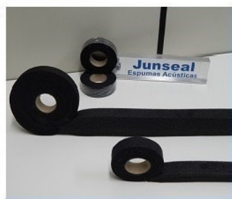
COMPRIBand Pré-Comprimido Auto Extinguível: Amortecimento e Vedação

Absorvedores Acústicos, para atenuação de ruídos em carenagens de máquinas como Compressores de Ar, Geradores de Energia e demais Equipamentos, atendendo a normas de auto-extinguibilidade e à Norma UL94 HF1.