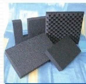
Junsorb: Absorvedor Acústico Auto-Extinguível