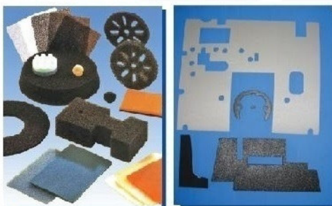
Peças Técnicas para filtragens de particulados (espuma filtro), e para isolamento