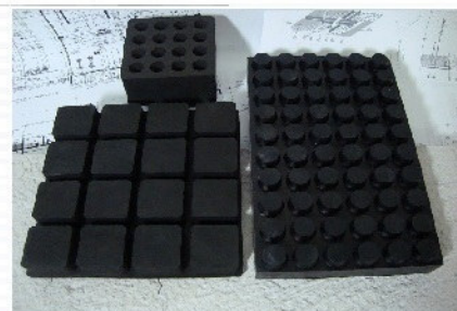
Placas encaixáveis com exclusivo PAD isolador Vibranihil